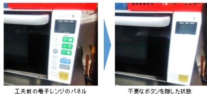
工夫前の電子レンジのパネル